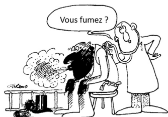
Figure 2. Les maladies professionnelles ne sont pas reconnues

La figure 2 illustre de manière humoristique cette problématique : un ramoneur va chez son médecin pour des problèmes respiratoires et la première question du médecin concerne le tabac et non la profession ! Il est intéressant de rappeler qu'il y a plus de 300 ans, le père de la médecine du travail, le médecin Bernardino Ramazzini, préconisait à ses collègues de poser toujours comme première question à leur patient : « Quel métier faites-vous ? ». Or, force est de constater que 300 ans plus tard, ce n'est toujours pas la première question du médecin !