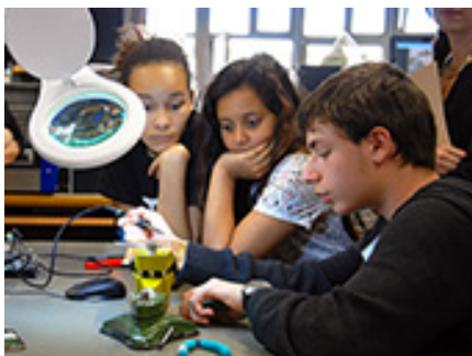
A Lancy, des apprentis présentent aux enfants du primaire le contenu d'un téléphone Homme Suisse

Comment renforcer la participation des jeunes dans des actions concrètes de solidarité ? Une récente expérience a recours aux « élèves ambassadeurs » pour accroître l'impact d'un message auprès du jeune public.