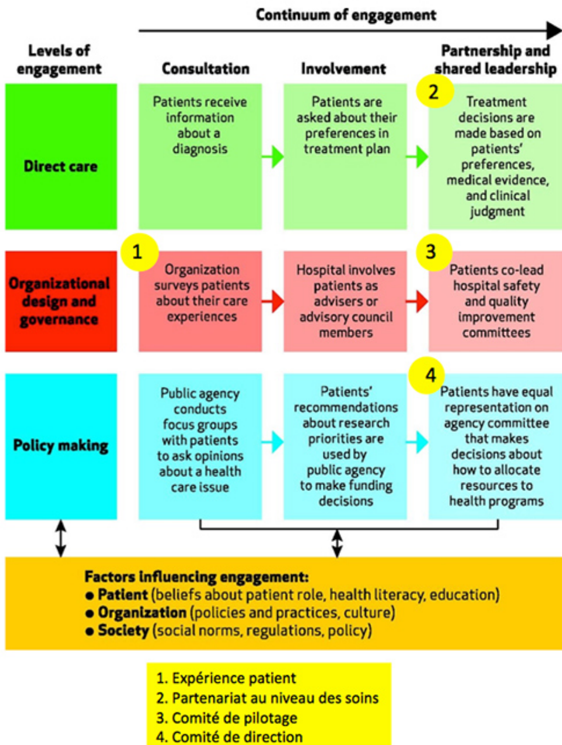
Figure 1 : Source : Carman et al., 2013

L'«Alliance sans frontières pour le partenariat», à laquelle la direction du RSRL a adhéré dès sa création en octobre 2019 à Nice, entend marquer sa détermination à avancer dans cette direction. De même que les initiatives se multiplient au niveau international et que leurs promoteurs cherchent à se mettre en relation et à échanger régulièrement sur le sujet, de nombreux acteurs dans le canton de Vaud sont déjà engagés d'une manière ou d'une autre sur le chemin du partenariat. La proposition de mettre sur pied une Communauté de pratiques à l'échelle