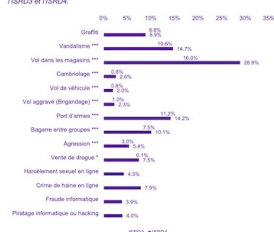
Graphique 1. Pourcentages de jeunes ayant commis des délits au cours de leur vie selon l'ISRD3 et l'ISRD4.

Degrés de significativité: *** p<0,001, ** p<0,01, * p<0,05. Note: les harcèlements sexuels en ligne, les crimes de haine en ligne, la fraude informatique et le piratage informatique n'ont pas été traités lors de la troisième édition de l'ISRD. Autre aucun pourcentage n'est mentionné.