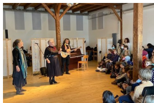
Spectacle Ramène ta chaussure, le 5 décembre 2021 à Fribourg

Ensuite, les ateliers de création participative « Quo vadis » (où vas-tu ?) ont encouragé des personnes d'ici et d'ailleurs — notamment des familles — à faire connaissance, à échanger de manière ludique sur différentes expériences de la Saint-Nicolas, puis à tisser des liens avec d'autres fêtes à la symbolique proche ; les participant·e·s ont, à leur tour, été invité·e·s à produire des objets artistiques autour du symbole de la chaussure. Le but ici était de partager les parcours de vie et de migration, ainsi que leur sentiment d'appartenance à un lieu.