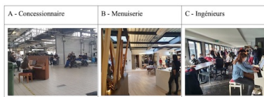
Fig 3 - Espaces de concerts dans les différentes entreprises

Finalement, il apparaît qu'assister aux concerts dans un espace déconnecté des postes de travail usuels encourage l'adoption des interventions musicales. Cela a été le cas pour les menuisier·e·s et les ingénieur·e, dont respectivement le showroom et l'espace de pause ont été reconvertis pour accueillir le piano et les interludes. Ces pauses permettent un effet de coupure et de reprise de soi.