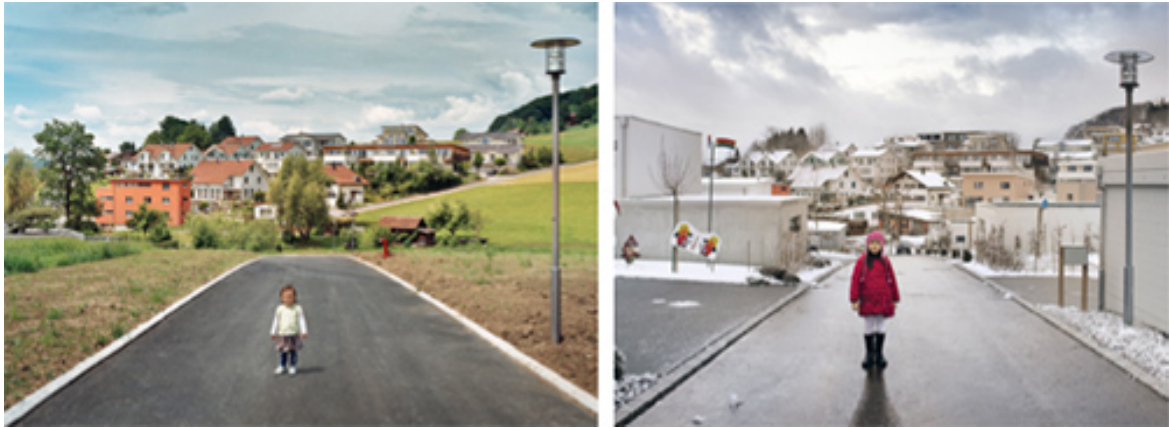
L'idéal de la « maison avec jardin » met le paysage sous pression : Buttisholz (LU). 2005 et 2011