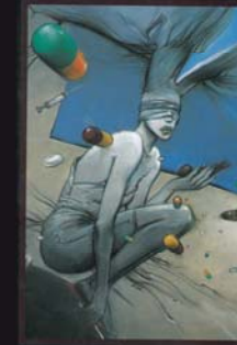
BD no suicide offerte par Children Action